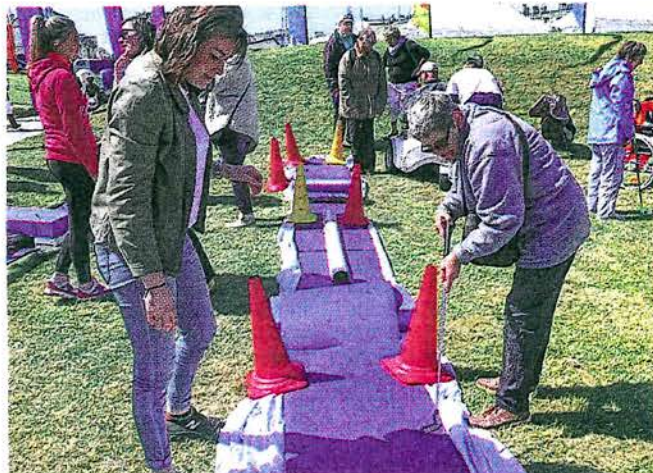
Le stand du mini-golf n'a pas désempli de la journée. Tous, en fauteuil ou non, ont pu tester !